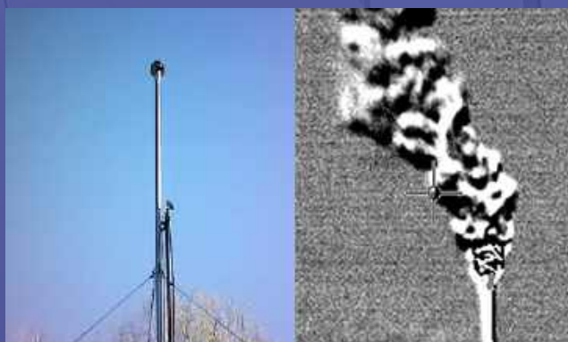
Voorbeeld van een gascamera-opname.

Ondanks regelmatig onderhoud zijn gaslekkages bij biogasinstallaties een veelvoorkomend probleem. Deze gaslekkages kunnen gevaren met zich meebrengen en brand, explosies of milieuschade veroorzaken. Het lastige is dat deze lekkages niet met het blote oog zijn waar te nemen. Gelukkig bieden wij een oplossing: optical gas imaging (OGI) met een daarvoor geschikte IR-camera. De IR-camera is een draagbaar, optisch instrument waarmee VOS-emissies real-time zichtbaar kunnen worden gemaakt. Door regelmatig in kaart te brengen óf en waar er lekkages plaatsvinden, zullen deze op tijd verholpen kunnen worden. Dit zorgt voor minder risico's, een verhoogde efficiëntie en voorkomt dat er methaan in de atmosfeer terechtkomt. Onze gascamera-inspecties voldoen aan de NTA 8399-richtlijnen.